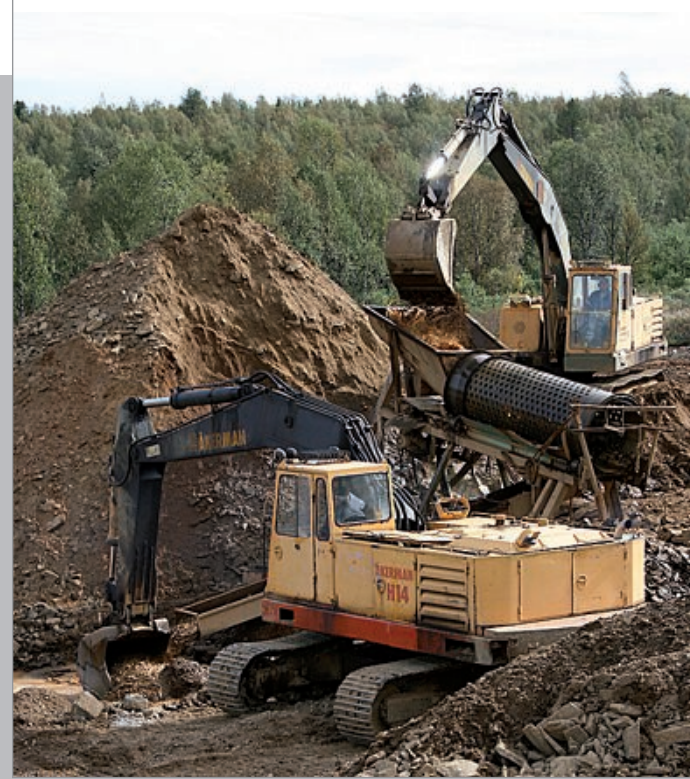
Mika Telilä syöttää maata rumpuun ja Risto Telilä siirtää rännin alta seulottua maata pois. Myös Telilät tietävät kuinka koneita korjataan. Tela- ja moottoriremontit ovat tulleet tutuiksi.

Korhosenojalla Tauno mättää maata seulaan noin 100 metrin levy-