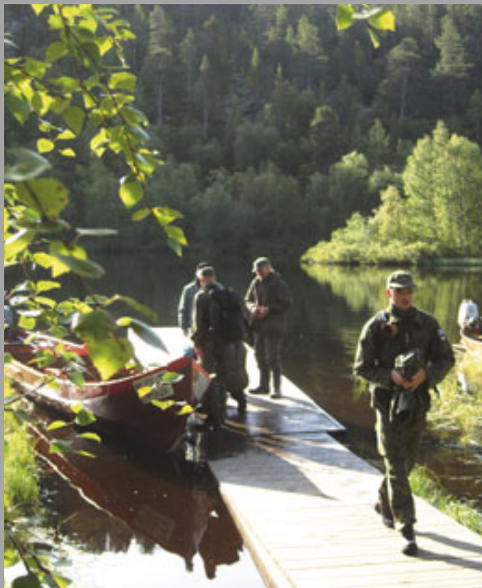
Inarin Njurkulahdesta Kultahaminaan (kuvassa) on reilun 20 kilometrin venematka. Vajaat puolitoista tuntia kestävä venematkan jälkeen on patikoitavana reilut 10 kilometriä Miessijoen valtauksille. Retkeilijöitä Lemmenjoen kansallispuistossa käy vuosittain noin 10.000, joista vain harva kulkee kultamaille asti.