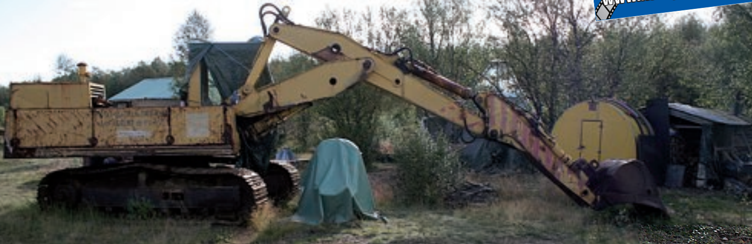
Koneellista kaivuuta Lemmenjoella kokeiltiin jo 50-luvun alussa, mutta ensimmäinen yritys meni mönkään. Nykyäänkin käytössä oleva kalusto on pääosin aika läkästä. Tämä kaivukonevanhus odottaa enää kuljetusta pois kultamailta. Kokonaisuena se tuskin sijoiltaan enää liikahdaa.